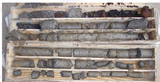
Extrait de la carotte du forage FP8 : remblai pollué