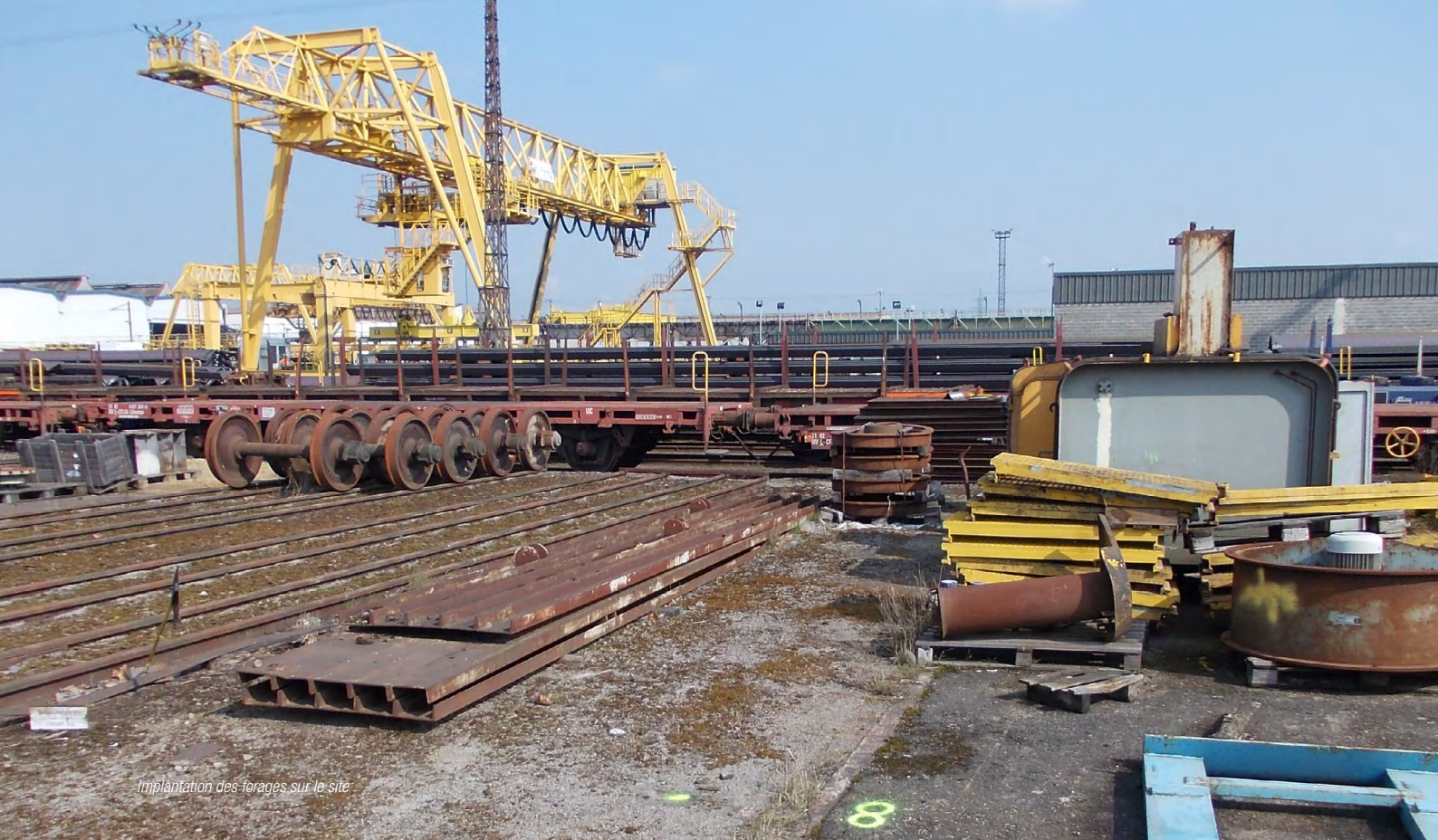
Implantation des forages sur le site